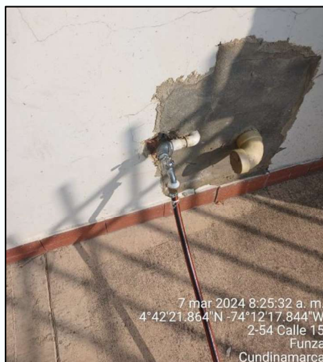
Ilustración 1. Llave pista de patinaje

De acuerdo al asunto de referencia y con el fin de dar alcance a la queja interpuesta ante la Secretaría de Ambiente y Bienestar Animal, referente al uso inadecuado del recurso hídrico en la comunidad y específicamente en la pista de patinaje del municipio, se realizó visita técnica ambiental No. 023 el día 7 de marzo del 2024, la cual fue atendida por el coordinador de escenarios deportivos del Instituto Municipal para la Recreación y el Deportes de Funza, quién manifestó que en dicho escenario solo se encuentra una (1) llave, la cual se encuentra ubicada detrás de la caseta de vigilancia en las coordenadas 4°42'21.964" N y 74°12'17.844 W, como se muestra en la siguiente ilustración.